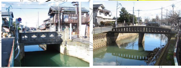
会の川に架かるレトロな石橋

スタート: 加須駅 ⇒⇒ 観光案内所 ⇒⇒ 会の川親水公園 ⇒⇒ 上之橋 ⇒ 羽根橋 ⇒ 徒歩橋 ⇒⇒ ⇒⇒ 龍蔵寺 ⇒⇒ 稲荷神社 ⇒⇒ 総願寺 ⇒⇒ 諏訪神社 ⇒⇒ 会の川親水公園 ⇒⇒ ⇒⇒ 光明寺 ⇒⇒ 千方神社 ⇒⇒ 加須駅 :ゴール 総距離:5.5km 約2時間 (逆回りも可)